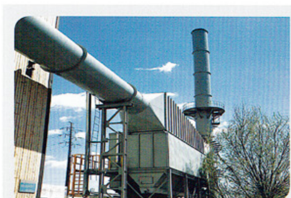
钢铁 Steel industry