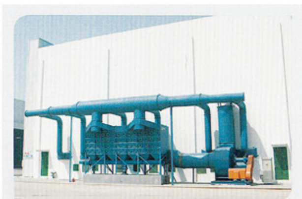
金属加工 Metal processing