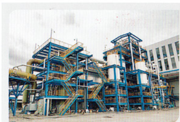
焚烧和锅炉烟气 Incineration and boiler flue gas