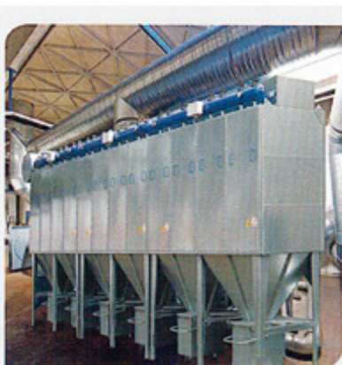
造纸 Pulp and paper