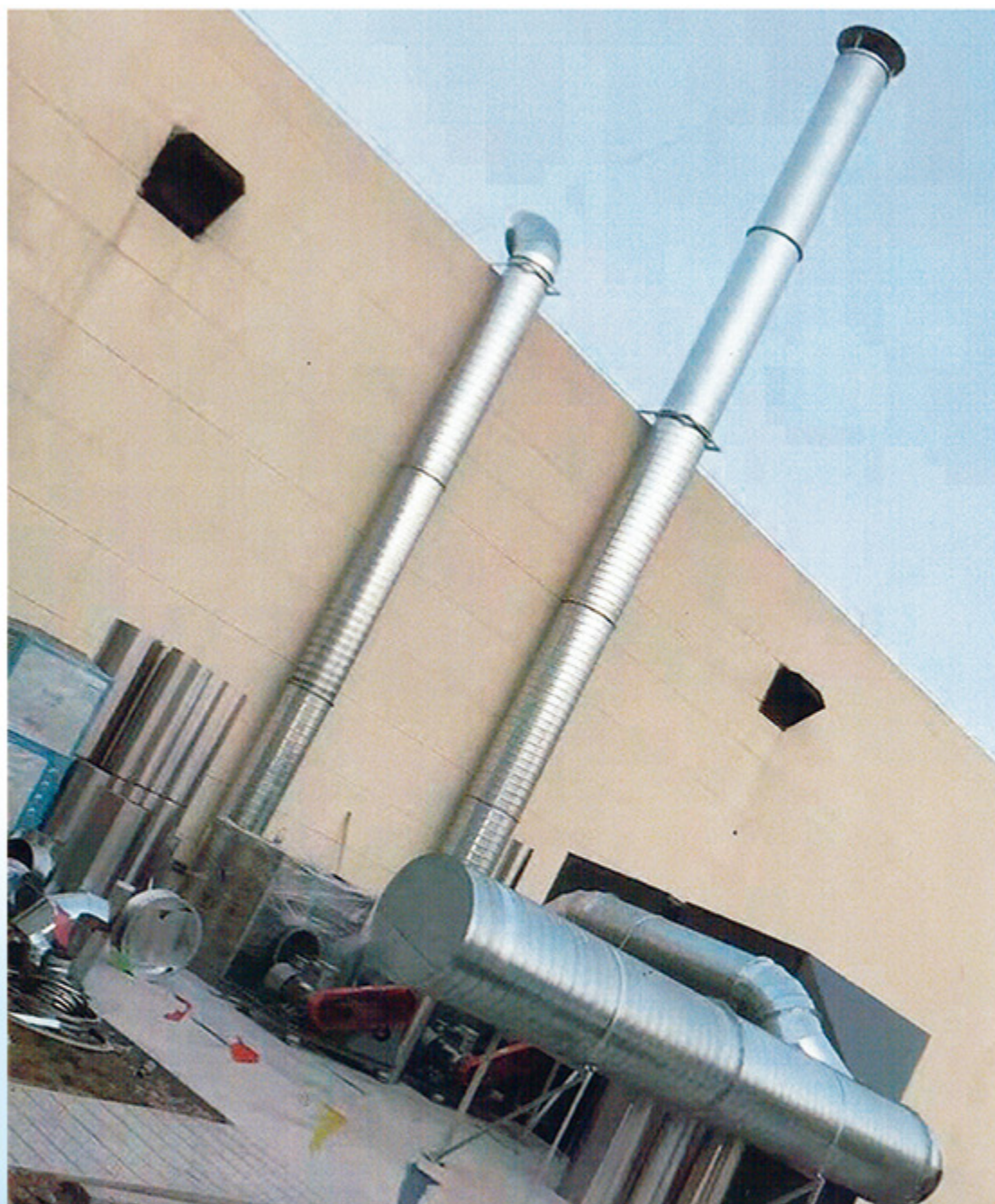
苏州高新区光电废气治理项目