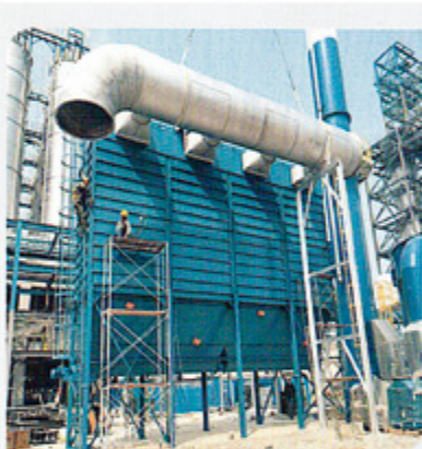
电力 Electric power