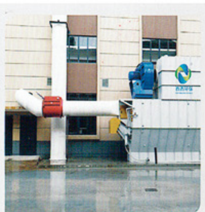
航天 Space flight