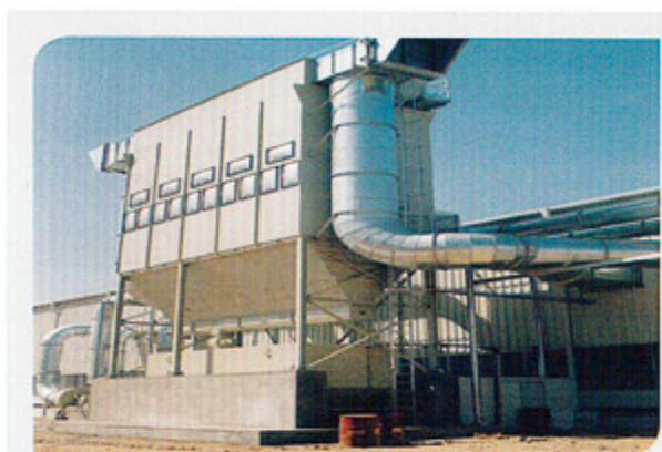
木材加工 Wood processing