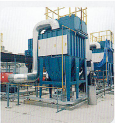
新能源 New energy resource