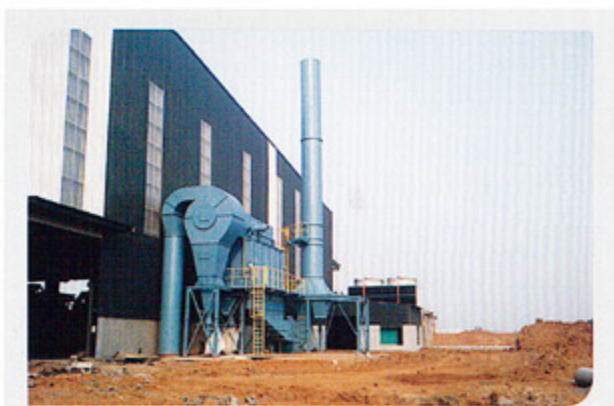
铸造和冶炼 Casting and smelting