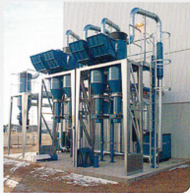
复合材料加工 Composite material processing