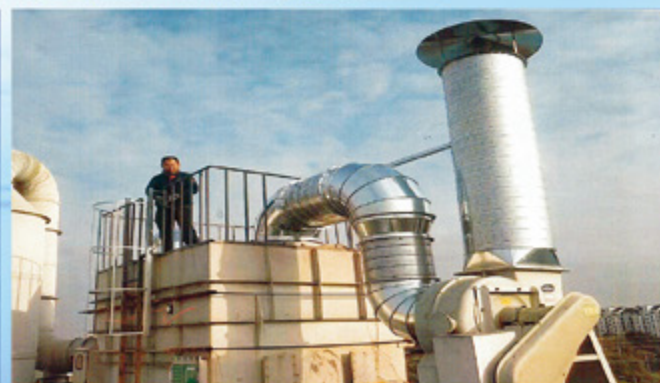
苏州高新区电子废气处理项目